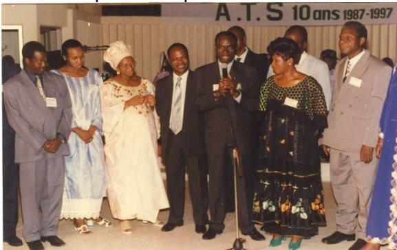
Il y a 10 ans déjà

Nous vous le devons, c'est pourquoi nous célébrerons ensemble cet important cap durant toute l'année 2007.